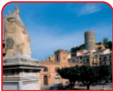
◀ Salemi: piazza Libertà e sullo sfondo il Castello Normanno de-