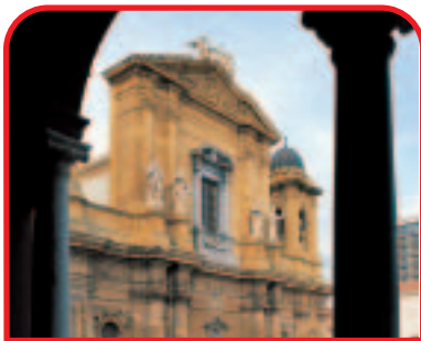
Marsala: il Duomo, XII-XVII secolo