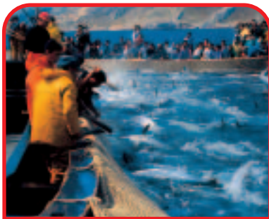
← Isole Egadi: Favignana, la tradizionale pesca del tonno